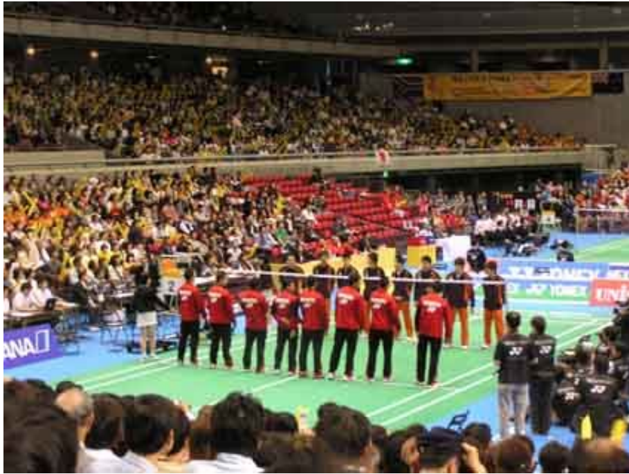
2006年 第24回トマス杯大会 東京都体育館